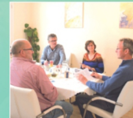
Herstellung von Salben, Tees und Tinkturen

Hinweis: „Die von mir angebotenen Therapieverfahren - ausgenommen Hypnose - sind wissenschaftlich umstritten und werden von der Schulmedizin nicht anerkannt. Beschriebene Folgen beruhen ausschließlich auf dem Erfahrungswissen der Naturheilkunde bzw. der Alternativmedizin. Wissenschaftliche Nachweise über die Wirkungen nach den anerkannten Regeln und Grundsätzen wissenschaftlicher Forschung liegen nicht vor. Der Verlauf und Erfolg der Behandlung hängt zudem stets von individuellen Faktoren des Patienten ab. Eine Heilung oder Linderung einer Erkrankung kann deshalb nicht zugesichert oder garantiert werden.“