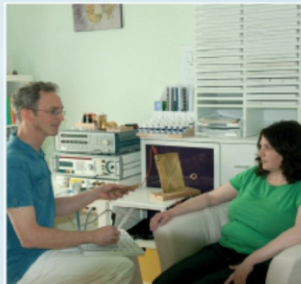
Testung mit dem Bioresonanzgerät

Die tatsächlichen und oft versteckten Ursachen Ihrer akuten und chronischen Beschwerden gilt es herauszufinden und die therapeutischen Maßnahmen dementsprechend darauf abzustimmen. Neue Symptome folgen, wenn nicht die Ursache erkannt wird und die krankmachenden Denk- und Verhaltensmuster verändert werden.